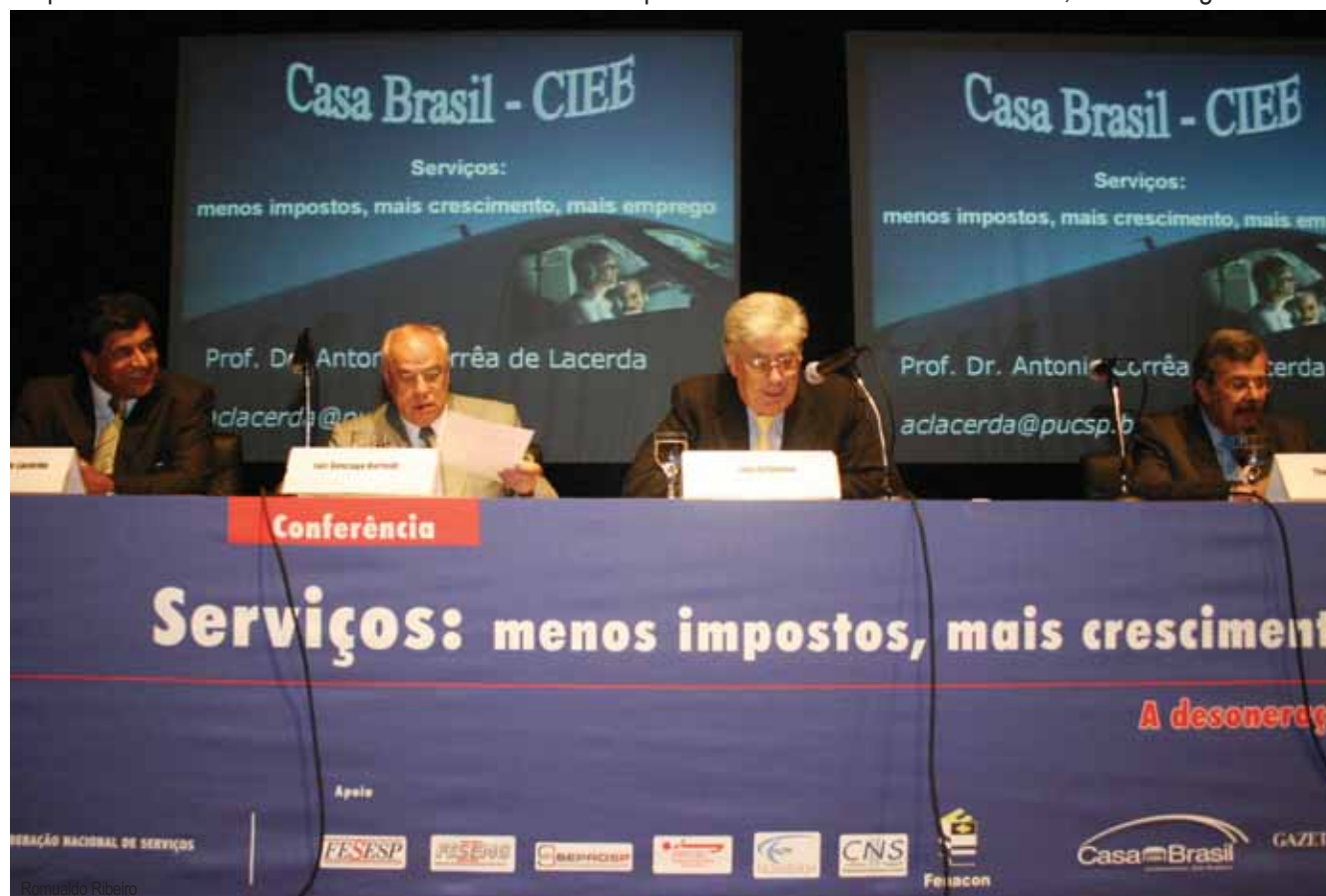
Especialistas relacionam desoneração da folha de pagamento a crescimento sustentado