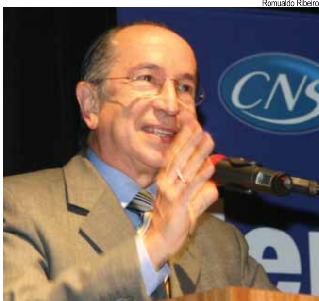
Marcos Cintra Economista e Prof. da FGV

O diagnóstico do advogado é, em certa medida, semelhante ao do economista Marcos Cintra, para quem existe temor por parte dos governantes de que uma mudança na legislação sobre tributos influencie nos números do superávit primário. Cintra, que foi deputado federal pelo PFL, defende há anos o imposto único, que inicial-